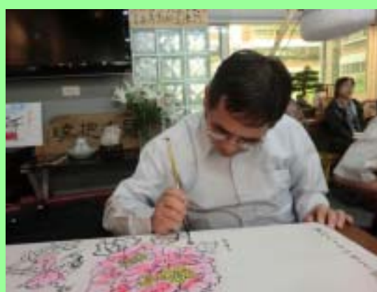
謝老師於畫上簽名