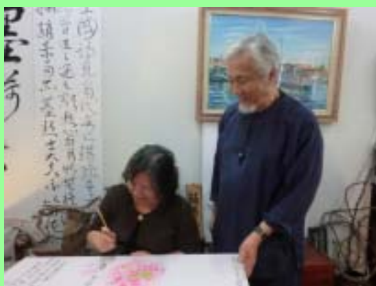
蔣理事長於畫上簽名