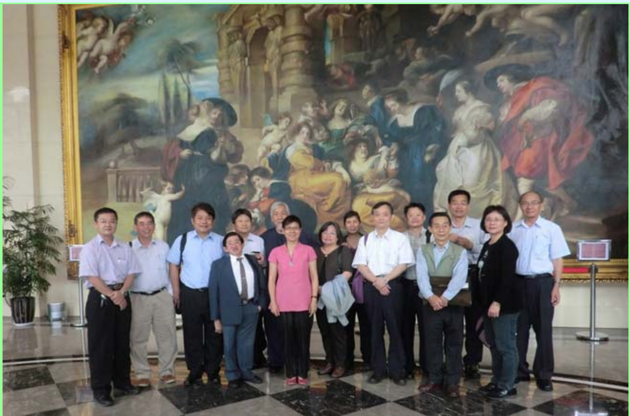
竹南聯誼會大合照