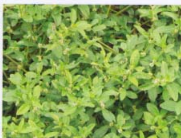
滿天星 蓮子草 Alternanthera sessilis