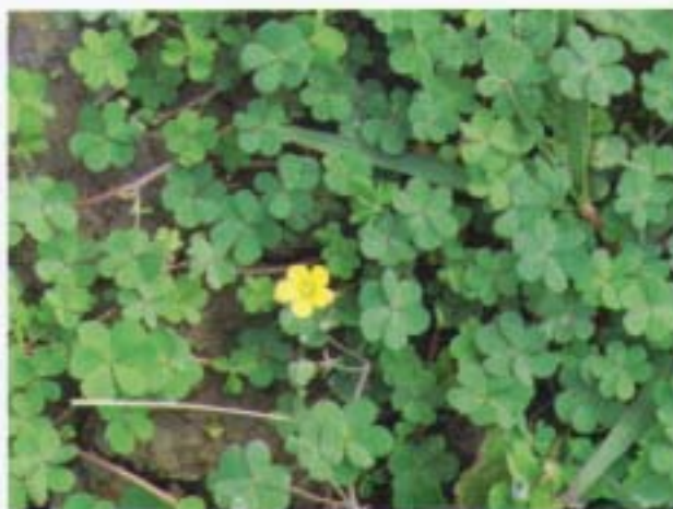
酢漿草 黃花酢漿草 Oxalis corniculata