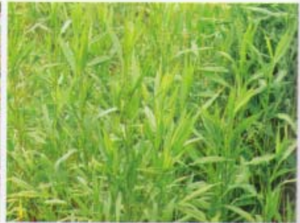
掃帚菊 帚馬蘭 Aster subulatus var. subulatus