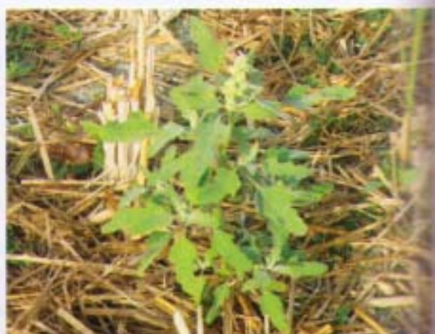
小葉灰藜 狗屎菜 Chenopodium serotinum