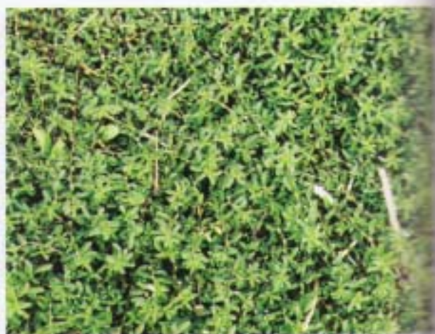
節花路蓼 假扁蓄 Polygonum plebeium