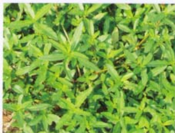
節節花 Alternanthera nodiflora