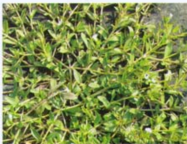
泥花草 鋸葉定經草 Lindernia antipoda