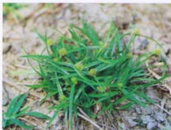
短葉水蜈蚣 水蜈蚣