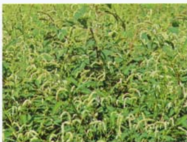
早苗蓼 早辣蓼 Polygonum lapathifolium