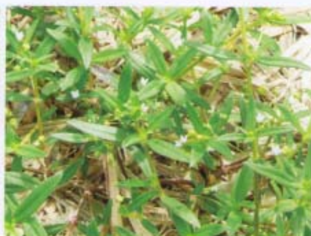
繖花龍吐珠 珠子草 Hedyotis corymbosa