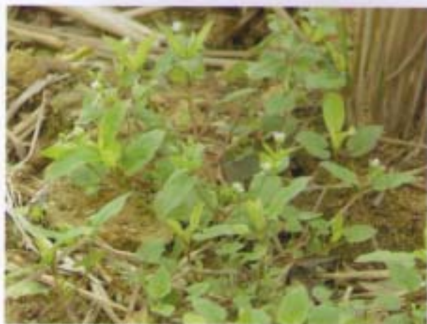
鵝兒腸 雜腸草 Stellaria aquatica