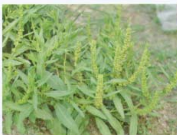
連明子 殺菜 Rumex maritimus