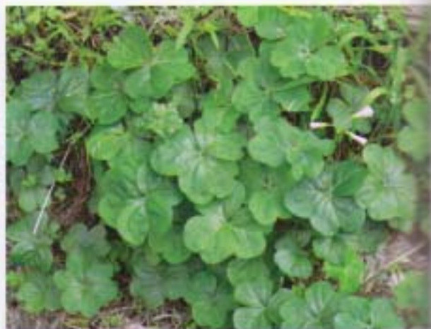
紫花酢漿草 大本鹽酸仔草 Oxalis corymbosa