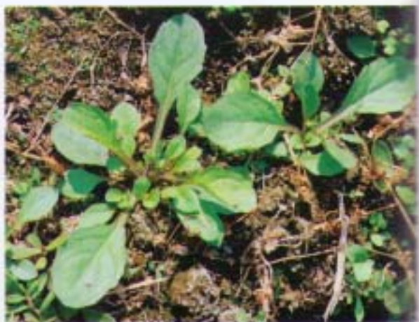
通泉草 六角定經草 Mazus pumilus