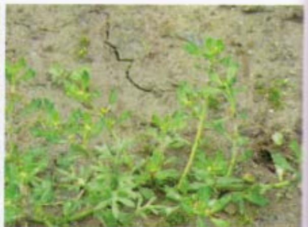
石胡荽 吐金草 Centipeda minima