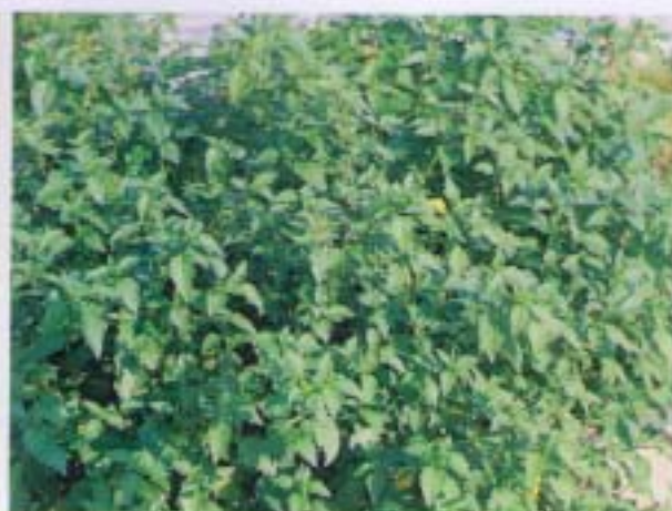
光果龍葵 Solanum americanum