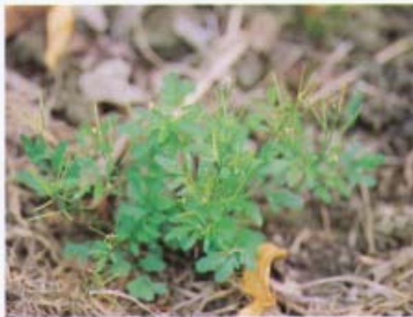
小葉碎米薺 碎菜 Cardamine flexuosa