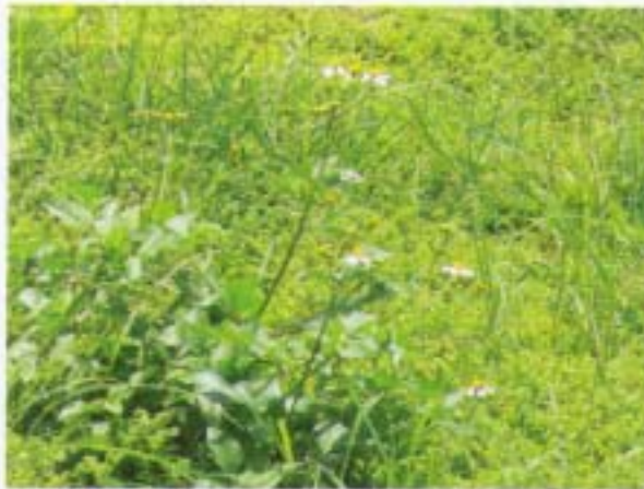
大花咸豐草 大白花鬼針 Bidens pilosa var. radiata