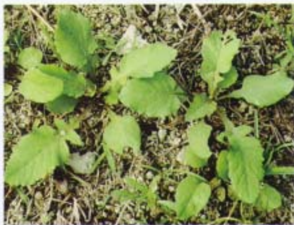
山芥菜 葶藶 Rorippa indica