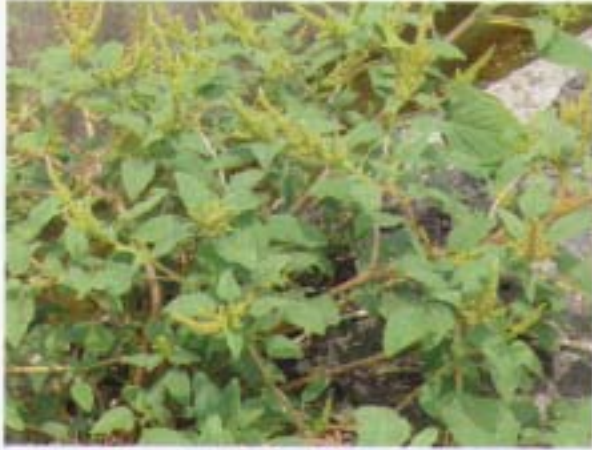
野莧 綠莧 Amaranthus viridis