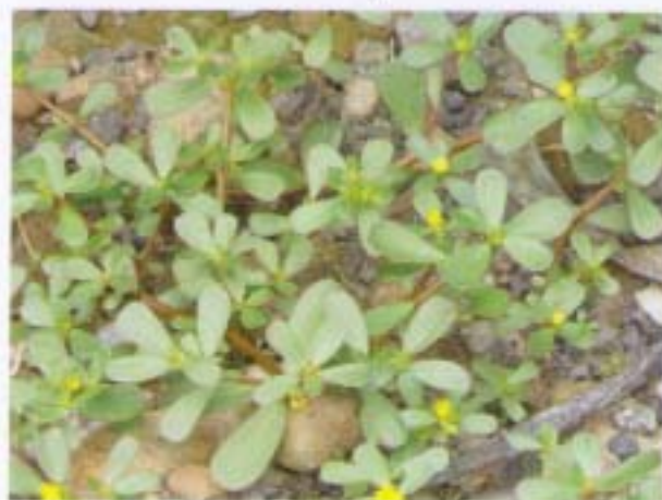
馬齒莧 豬母乳 Portulaca oleracea