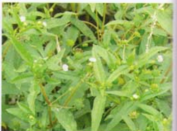
鱧腸 墨草 Eclipta prostrata