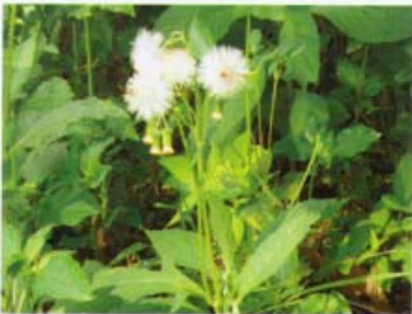
昭和草 飢荒草 Crassocephalum crepidioides