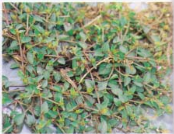
定經草 心葉母草 Lindernia anagallis